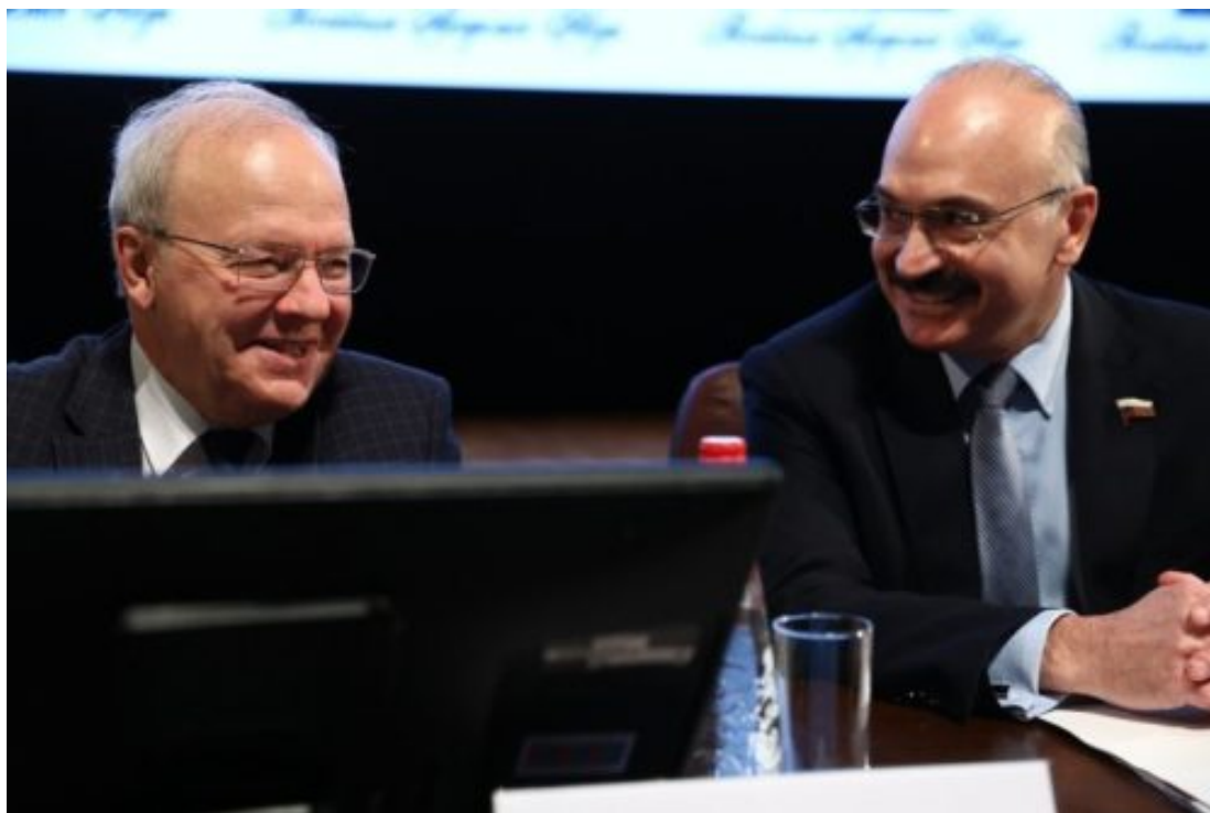
ВИЦЕ-ПРЕЗИДЕНТ РАН АЛЕКСЕЙ ХОХЛОВ И ПРЕДСЕДАТЕЛЬ КОМИТЕТА ГОСДУМЫ ПО НАУКЕ И ВЫСШЕМУ ОБРАЗОВАНИЮ СЕРГЕЙ КАБЫШЕВ. ФОТО: «НАУЧНАЯ РОССИЯ»

Интересно, Александр Сергеев впервые узнал именно на Общем собрании РАН об озвученных тонкостях издательского вопроса?