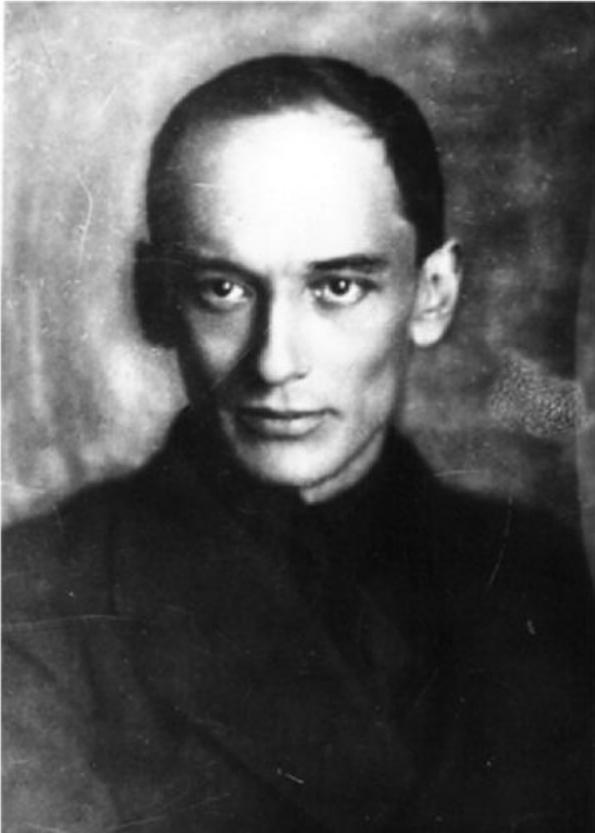
Портрет Бокия в 1918 г., когда он стоял по главе Петрочека

Главным и резонансным фигурантом этого процесса выступал начальник 9-го (секретно-шифровального) отдела ГУГБ НКВД СССР, комиссар госбезопасности 3-го ранга Глеб Иванович Бокий. Он происходил из академической среды: его родственники стали именами в русской и советской науке. Бокий, возможно, и сам сделал бы карьеру выдающегося ученого, но будучи студентом в Горном институте он стал революционером.